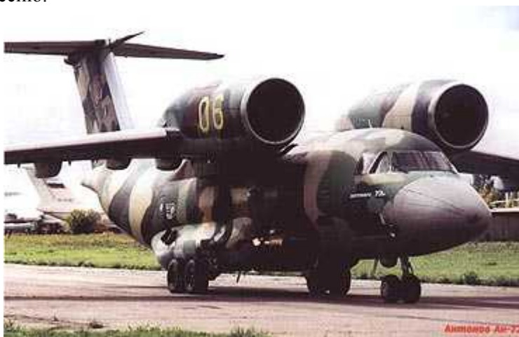
На снимке: Ан-72

Военно-транспортный самолет России «Ан-72», прозванный за характерное расположение двигателей «Чебурашка», грузоподъемностью 12 тн., совершил на днях первую челночную операцию и должен был вывезти партию вооружений из Тирасполя в Россию.