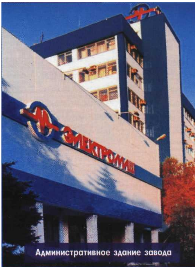
Административное здание завода

Вот, например, вменяют Крейчману сегодня продажу базы отдыха в Затоке и присвоение сумасшедших денег. На самом деле оказывается (смотри ссылку «Вернуть базы отдыха на Украине» http://youtu.be/LP3qFgmXem8 ), только Крейчман и боролся за сохранение этой базы для «Электромаша». Он дотошно перечисляет, что было для этого сделано, куда