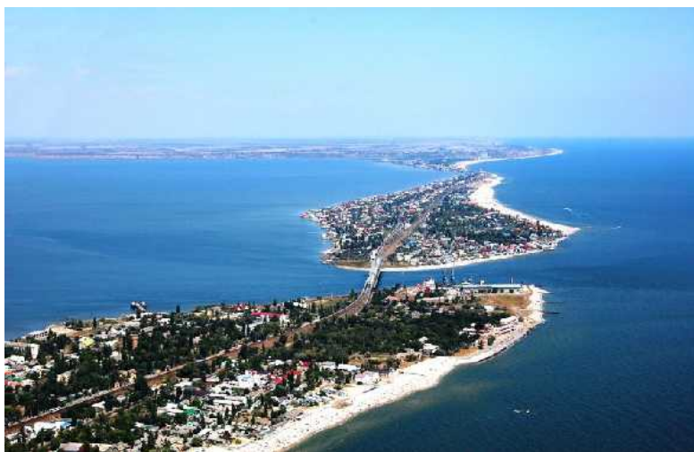
На снимке: Прекрасная Затока — украинский Солнечный Берег.

обращались, почему не достигли результата, в чем нужна помощь. И просит журналиста вмешаться. Говорит о сфабрикованных делах против тех, кто эту базу отстаивал из Наблюдательного совета «Электромаша», что приходилось не раз из украинских тюрем вытаскивать. Более того, Крейчман ставит вопрос не только по базе «Электромаша», называет 30 баз отдыха Приднестровья, которые их предприятия-владельцы и наше горе-государство отдало украинским рейдерам без малейшего сопротивления. Вот только один «Электромаш» и дрался.