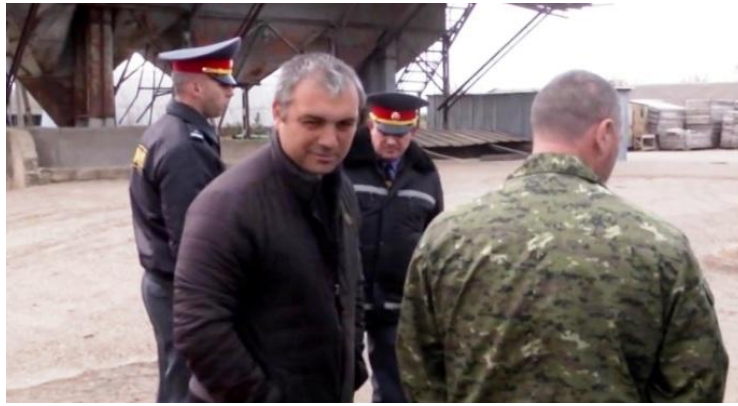
На снимке: Милиция препятствует трактористам выйти в поле на осенние полевые работы. Это не трактористы "Агро-Люкка" - так было повсеместно.

У нас по указанию сначала досрочно забрали землю, а потом досрочно отозвали кредит. Тут сидят многие руководители хозяйств, вы меня можете научить, когда из трех составляющих прибавочной стоимости, то есть, основные средства – земля, кредиты – оборотный капитал, у тебя нет двух (только – рабочая сила). Как работать, как зарабатывать?